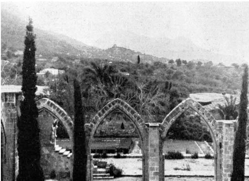
Ein Blick von der Abtei Bellapais zur Bergfestung St. Hilarion(Dieu d'Amour)